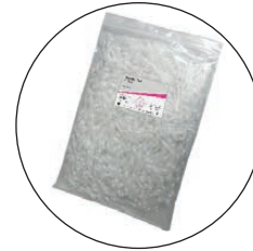
Boîte de pointes en vrac