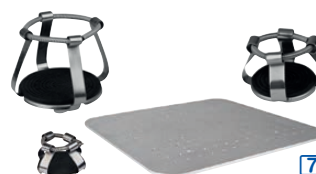
Plate-forme pour pinces tulipes pour flacons