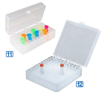
Boîtes magnétiques pour microtubes