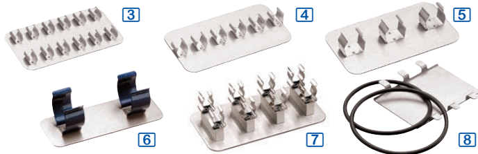
Portoirs magnétiques à pinces, pour tubes