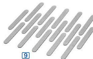
Bandes magnétiques pour sachets