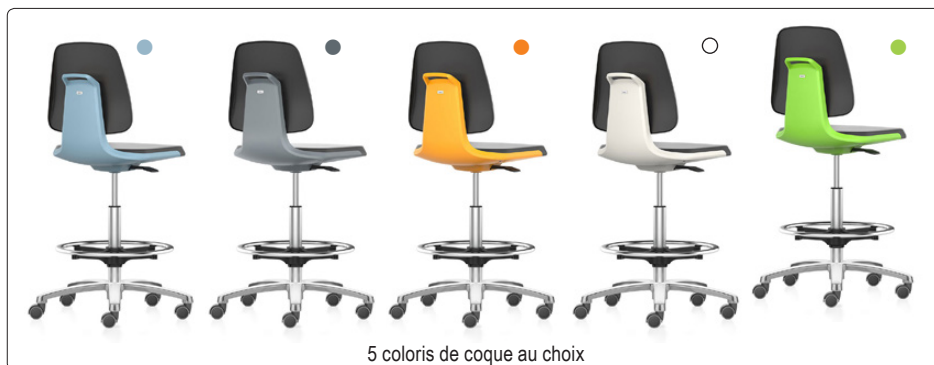
5 coloris de coque au choix