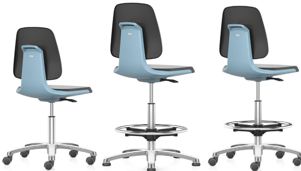
1 Labsit 2, sur roulettes, hauteur assise 450 - 650 mm